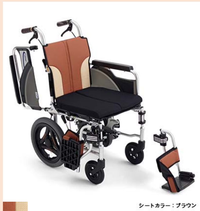
シートカラー：ブラウン