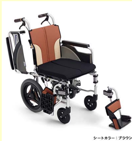
シートカラー: ブラウン