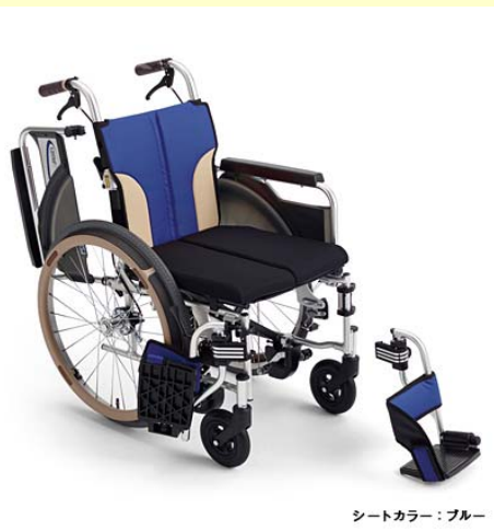
シートカラー: ブルー