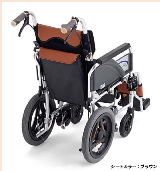
シートカラー：ブラウン